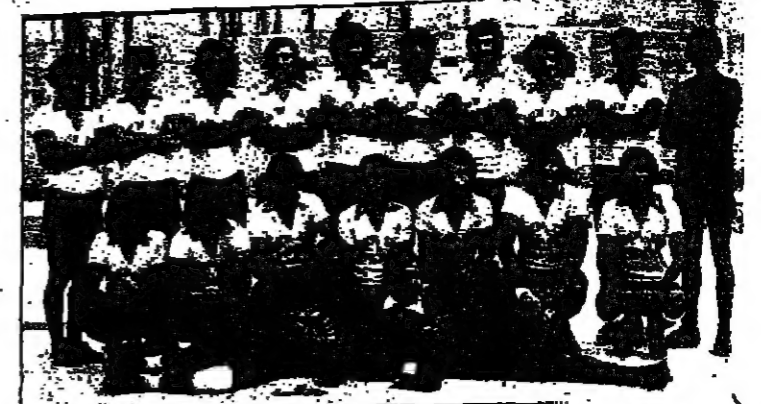
الاقاء الناصرة يفوز على كريات شمونة 2 : صفر